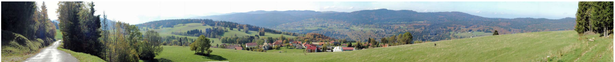
Photo panoramique de Giron